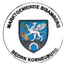
Bgm. DI Johannes Stuttner

Der Gemeinderat möge dem Antrag die Dringlichkeit zugestehen und den Tagesordnungspunkt unter TOP 20 in der öffentlichen Sitzung behandeln.